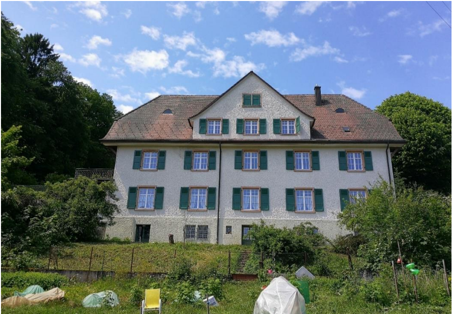
Freizeithaus Walten in Läuelfingen