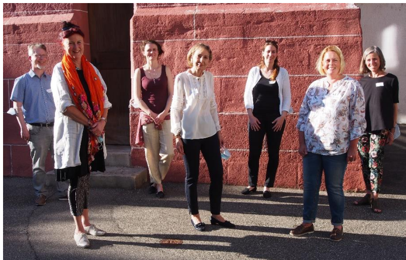
Vorstand Evangelische Frauenhilfe Baselland 2021